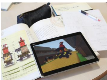
マイクラフトで再現した 昔の街並みを走る羅陵王の山車

川越市からの依頼を受け「かわごえ産業フェスタ（11月10日・11日 開催予定）」に出展予定のゼミは「川越まつり」をテーマとし、マイクラフトを使ったアプローチにより子どもからお年寄りまで幅広い年代に川越まつりの歴史や魅力を伝えて、地域と祭の振興を図り、本大会ではその活動を報告します。